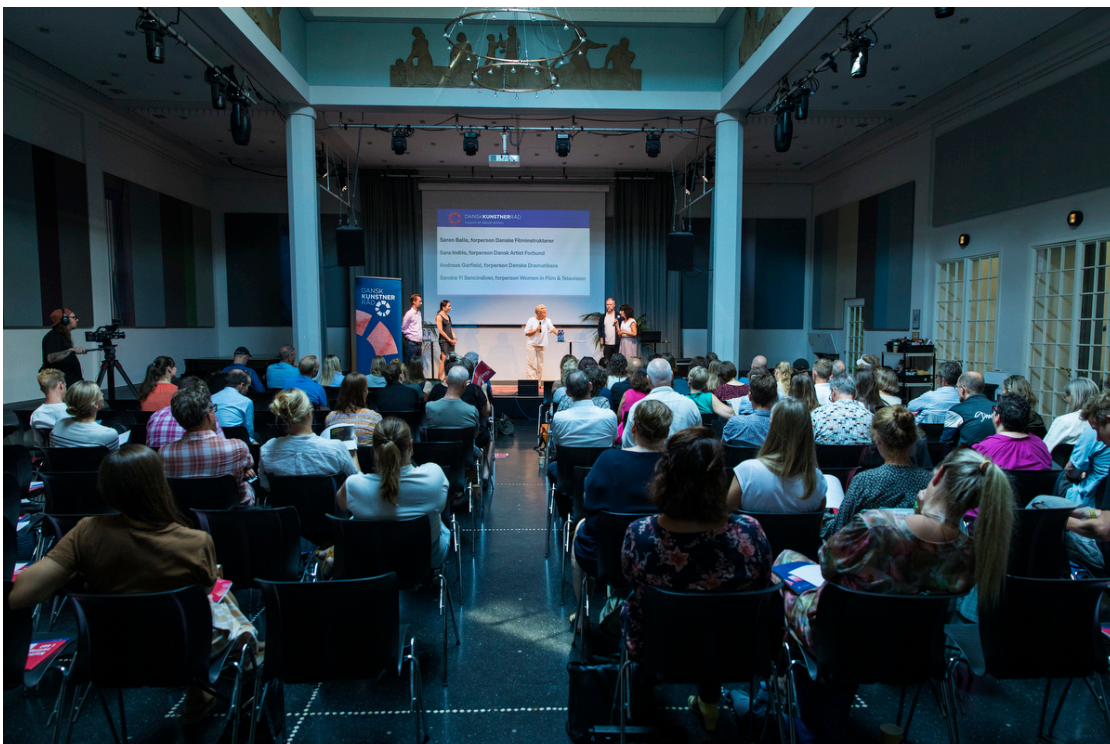
Lanceringsevent for "Kunstneres rettighedsmidler i tal" på Borups Højskole i København.